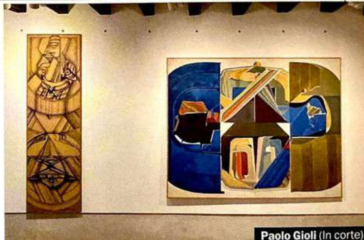
Paolo Gioli (In corte)