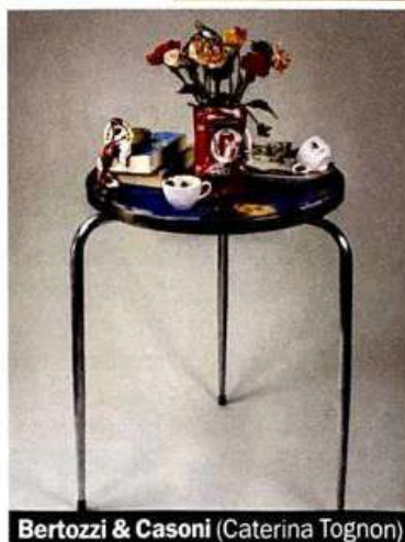
Bertozi & Casoni (Caterina Tognon)