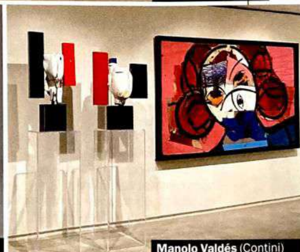
Manolo Valdés (Contini)